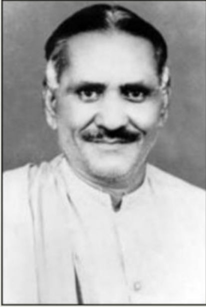
நாமக்கல் கவிஞர் வெ. இராமலிங்கம்